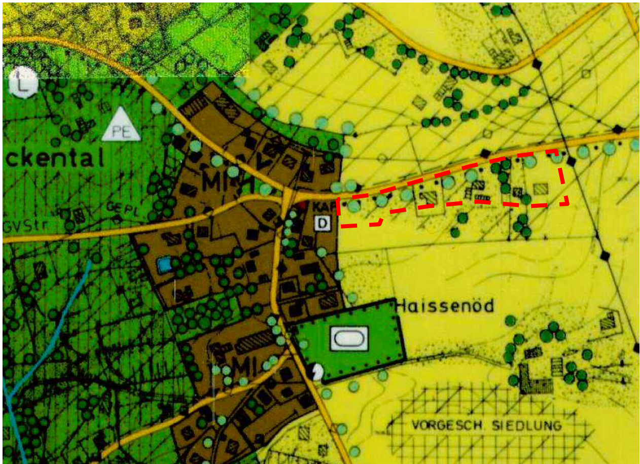
Wirksamer Flächennutzungsplan der Stadt Vilshofen an der Donau (nicht maßstäblich) Rot: Erweiterungsbereich Deckblatt Nr.4