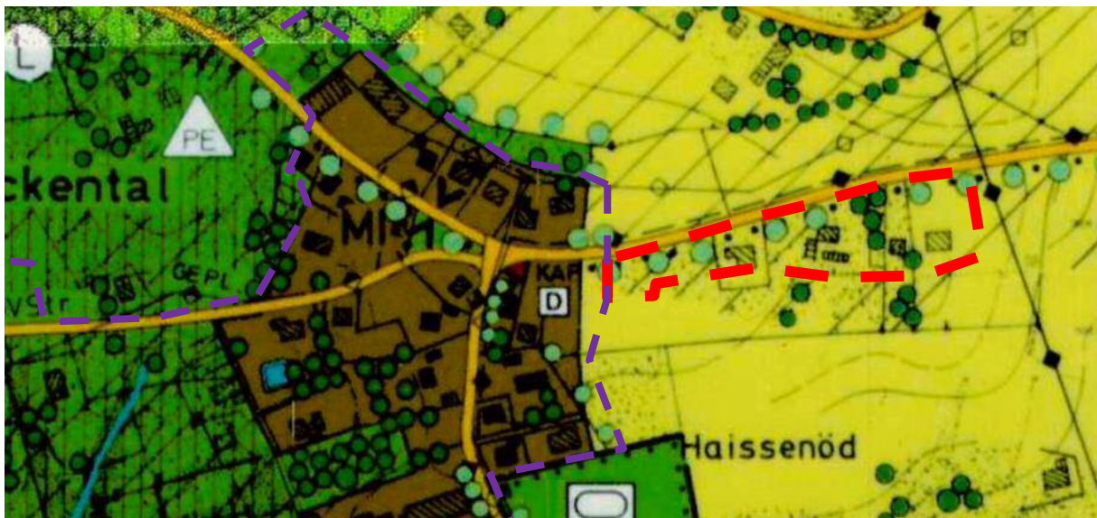
Auszug wirksamer Flächennutzungsplan der Stadt Vilshofen an der Donau (nicht maßstäblich)

Die dem Ortsteil zuzuordnenden Flächen sind im gemeindlichen Flächennutzungsplan derzeit wie folgt ausgewiesen.